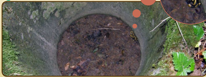
Salamandre tombée dans un trou à ras du sol