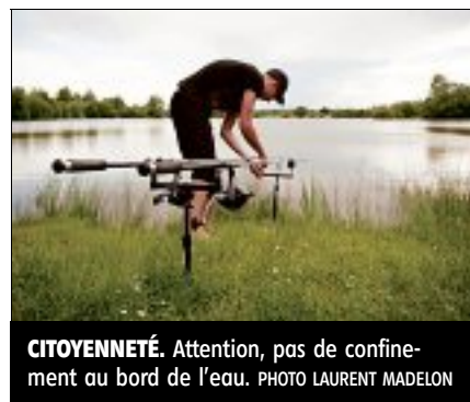
CITOYENNETÉ. Attention, pas de confinement au bord de l'eau.

Avec cette rubrique, retrouvez les conseils et les bonnes attitudes à adopter avec les chats et les chiens. Et les offres d'adoption en lien avec les refuges de la Nièvre.