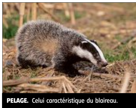
PELAGE. Celui caractéristique du blaireau.

Avec cette rubrique, retrouvez les conseils et les bonnes attitudes à adopter avec les chats et les chiens. Et les offres d'adoption en lien avec les refuges de la Nièvre. ■