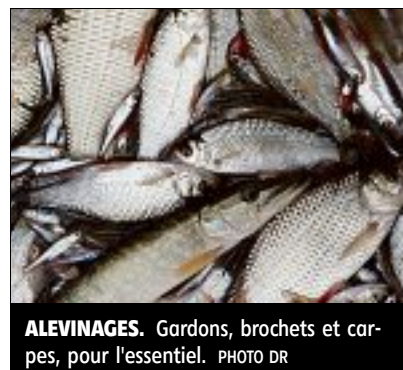
ALEVINAGES. Gardons, brochets et carpes, pour l'essentiel.

Avec cette rubrique, retrouvez les conseils et les bonnes attitudes à adopter avec les chats et les chiens. Et les offres d'adoption en lien avec les refuges de la Nièvre. ■