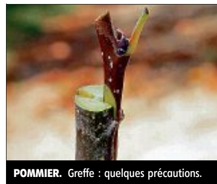
POMMIER. Greffe : quelques précautions.

Avec cette rubrique, retrouvez conseils et bonnes attitudes à adopter avec nos chats et chiens. Et puis aussi, les adoptions en lien avec les refuges de la Nièvre et de la SPA. ■