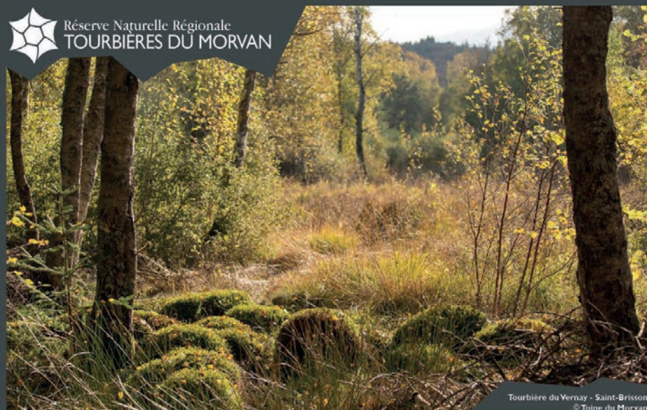
Tourbière du Vernay - Saint-Brissou