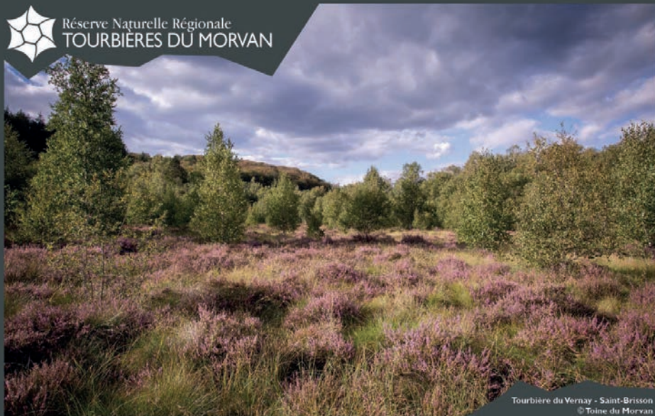
Tourbière du Vernay - Saint-Brissou