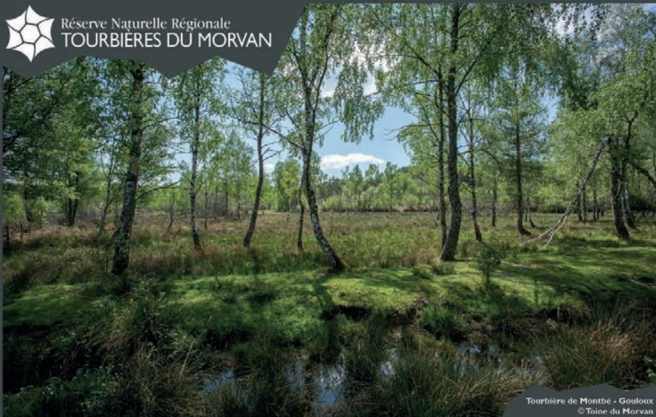
Tourbière de Montbé - Gouloux