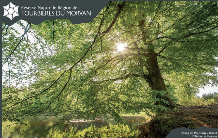
Etang de Préperny - Arleuf