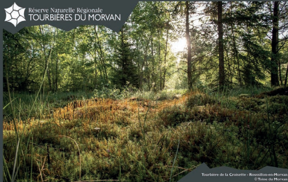
Tourbière de la Croisette - Roussillon-en-Morvan