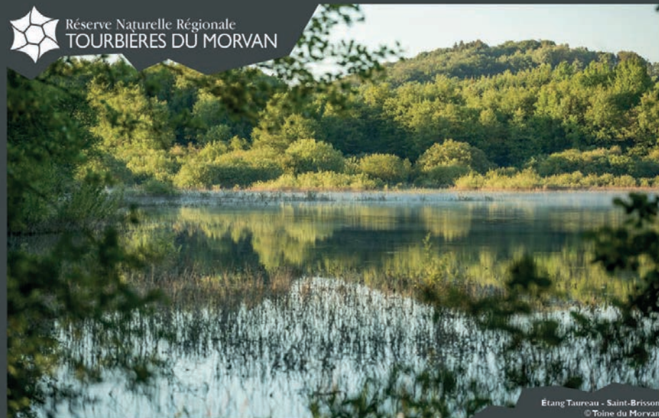
Étang Taurou - Saint-Brissou