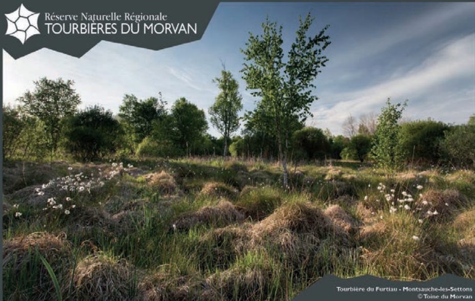
Tourbière du Furtiau - Montsauche-des-Settons