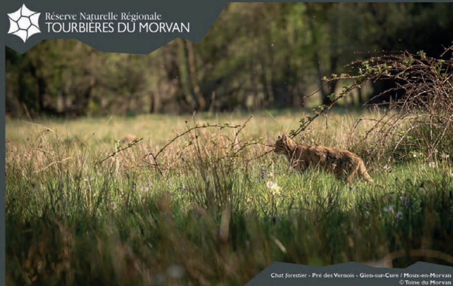
Chat forestier - Pré des Vernois - Gien-sur-Cure / Moux-en-Morvan