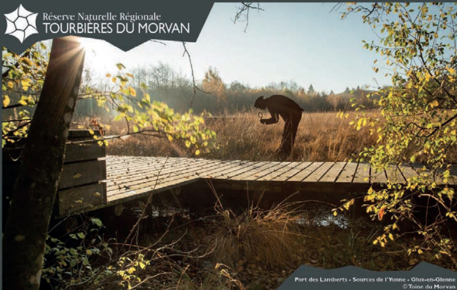
Port des Lamberts - Sources de l'Yonne - Givoux-en-Glenne