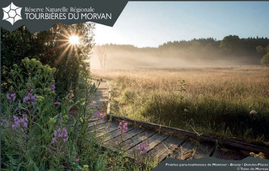
Prairies para-tourbeuses de Montour - Brassy / Dun-les-Places