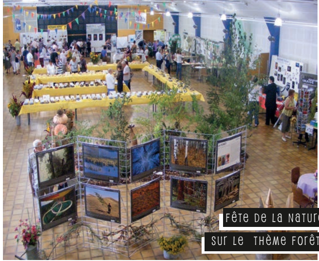
FÊTE DE LA NATURE SUR LE THÈME FORÊT

Fête de la nature et exposition mycologique qui a lieu chaque année, le dernier week-end de septembre sur une thématique différente (en 2021, le thème était : la forêt comtoise menacée par le changement climatique).