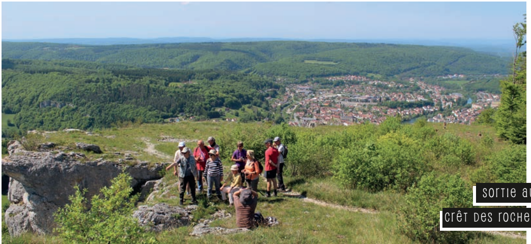
SORTIE AU CRÊT DES ROCHES