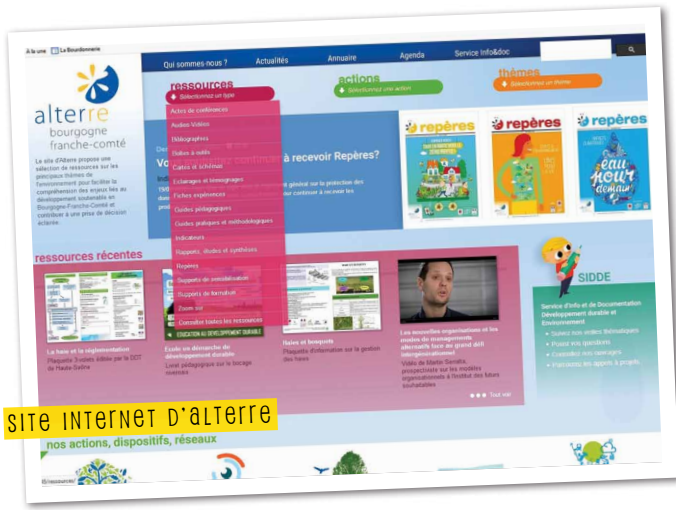
SITE INTERNET D'ALTERRE

Alterre produit et diffuse des connaissances et des expériences à travers différents types de supports tous accessibles en ligne. Parmi les productions phares de l'agence, le périodique Repères (disponible sur le site) peut être envoyé à toute personne en faisant la demande.