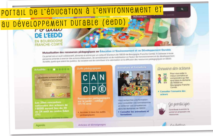
PORTAIL DE L'ÉDUCATION À L'ENVIRONNEMENT ET AU DÉVELOPPEMENT DURABLE (EEDD)

Outil collaboratif, alimenté et animé par un collectif d'acteurs de l'EEDD de la région, le portail s'adresse à toute personne amenée à exercer des actions d'éducation et de sensibilisation en faveur de l'environnement et du développement durable, quels que soient les publics.