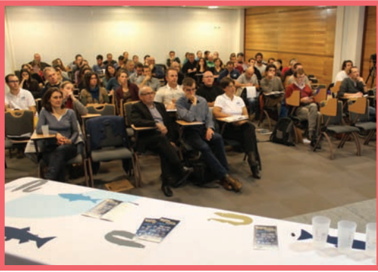
Rencontres Migrateurs Loire en 2016