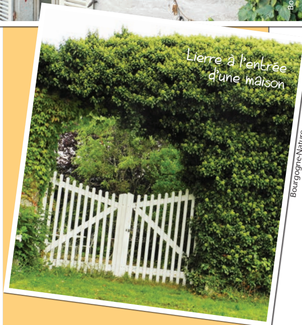
Lierre à l'entrée d'une maison