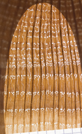
Coupe mince de Chêne liège

Un fascicule réalisé par Marion Lenoir, chargée d'inventaire, est à votre disposition sur demande.