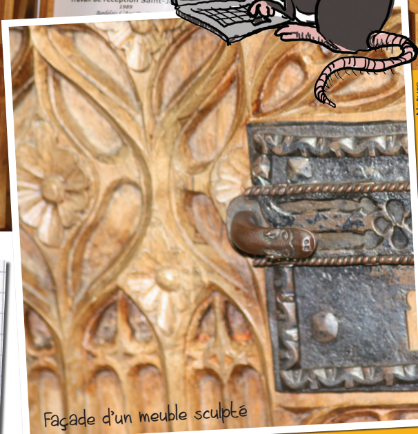
Façade d'un meuble sculpté