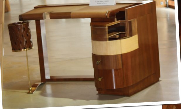
Meuble des années 30