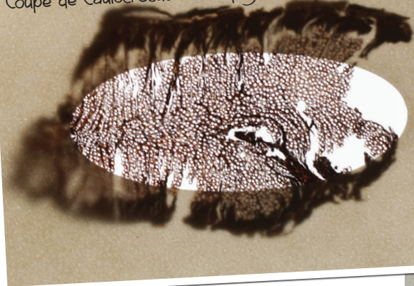
Coupe de Caulotretus heterophyllus (Kunth)