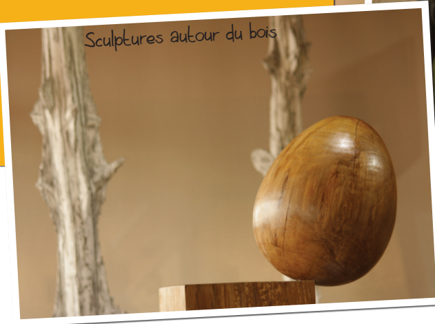
Sculptures autour du bois