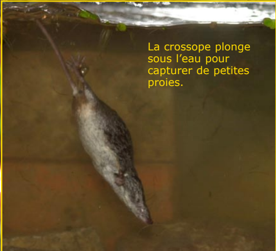
La crossope plonge sous l'eau pour capturer de petites proies.