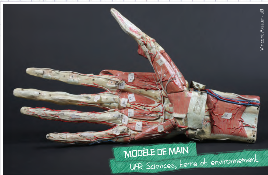
Vincent ARBELET - UB