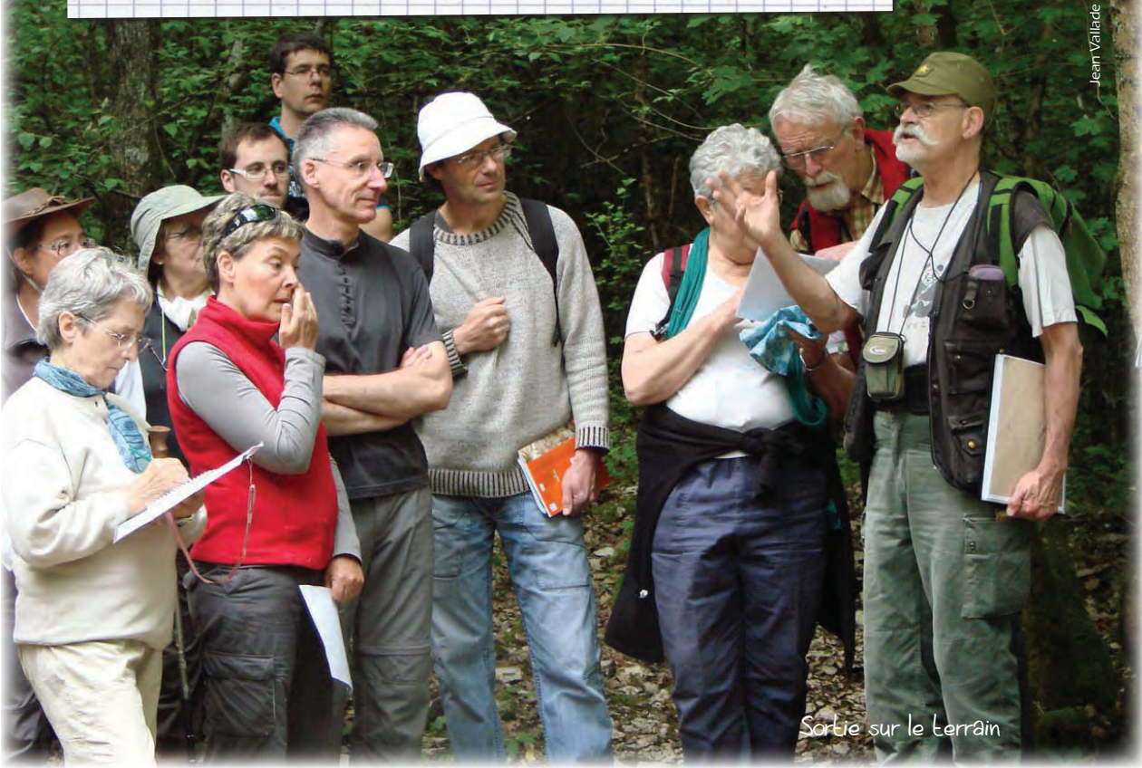
Sortie sur le terrain