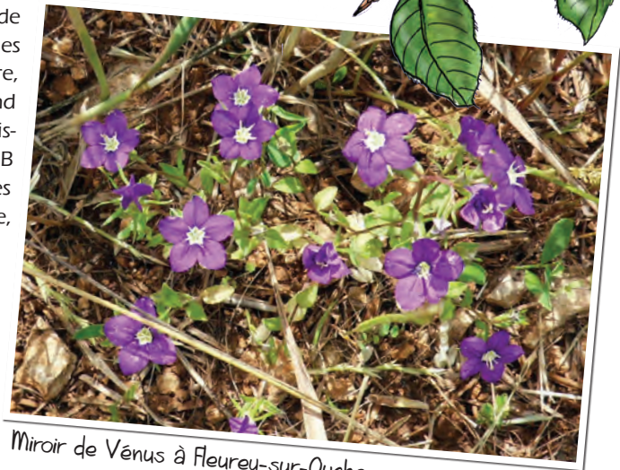
Miroir de Vénus à Fleurey-sur-Ouche