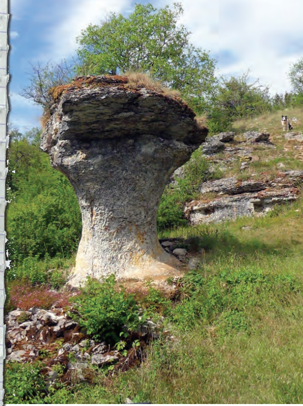
Le champignon, Fleurey-sur-Ouche, sentier des Roches d'Orgères