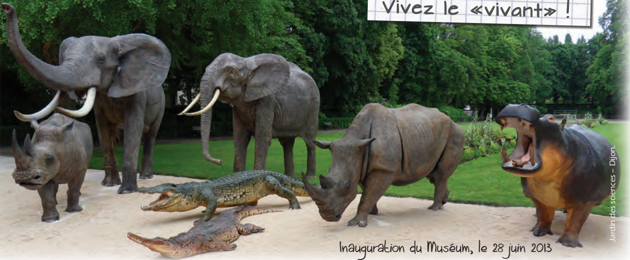
Inauguration du Muséum, le 28 juin 2013