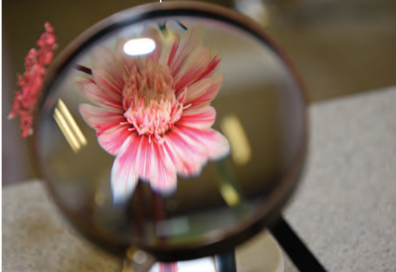
La nature à la loupe - Fête de la science 2014