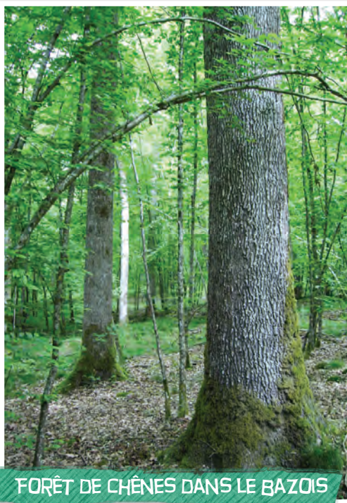
FORÊT DE CHÊNES DANS LE BAZOIS

Le CRPF s'adresse aux 165 000 propriétaires de forêt ; en Bourgogne, une famille sur cinq est propriétaire de bois.