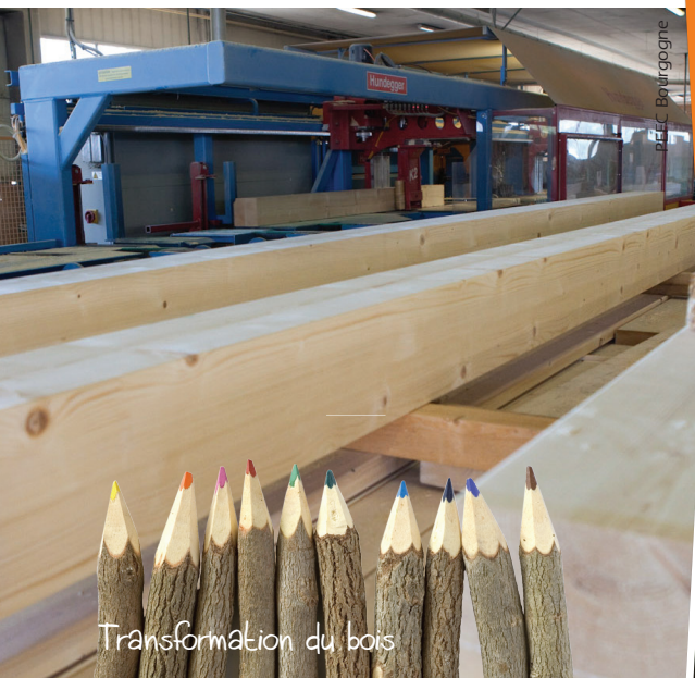
Transformation du bois

Ces trois principes sont la base même du système PEFC.