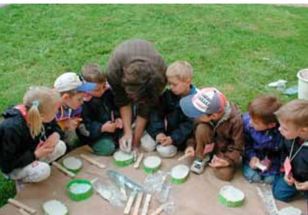
Une activité de terrain : le moulage d'empreintes d'animaux