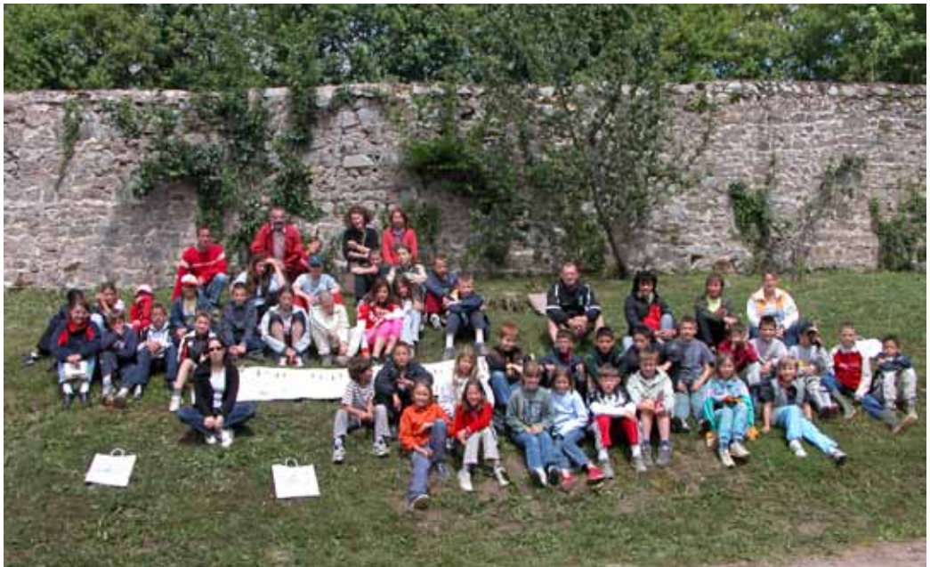
Collégiens du Morvan lors d'une journée mondiale de l'eau, le 22 mars, en partenariat avec l'Agence de l'Eau Seine-Normandie.

L'éducation au territoire, à l'environnement, à l'écocitoyenneté, au patrimoine, ... est au cœur des missions du Parc naturel régional. Tout au long de l'année, la Maison du Parc et son équipe accueillent des écoles du Morvan et de Bourgogne, des collégiens et des lycéens intéressés par le paysage et l'histoire du territoire, des étudiants, des chercheurs et des groupes d'adultes venant découvrir, au travers de la Maison du Parc, les différentes facettes du Morvan.