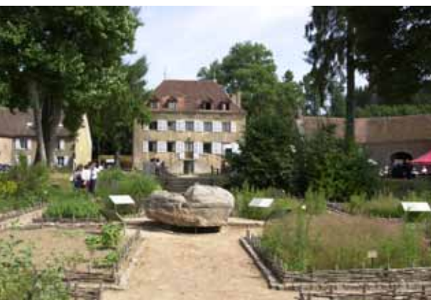
La maison du Parc avec en premier plan son herbarium