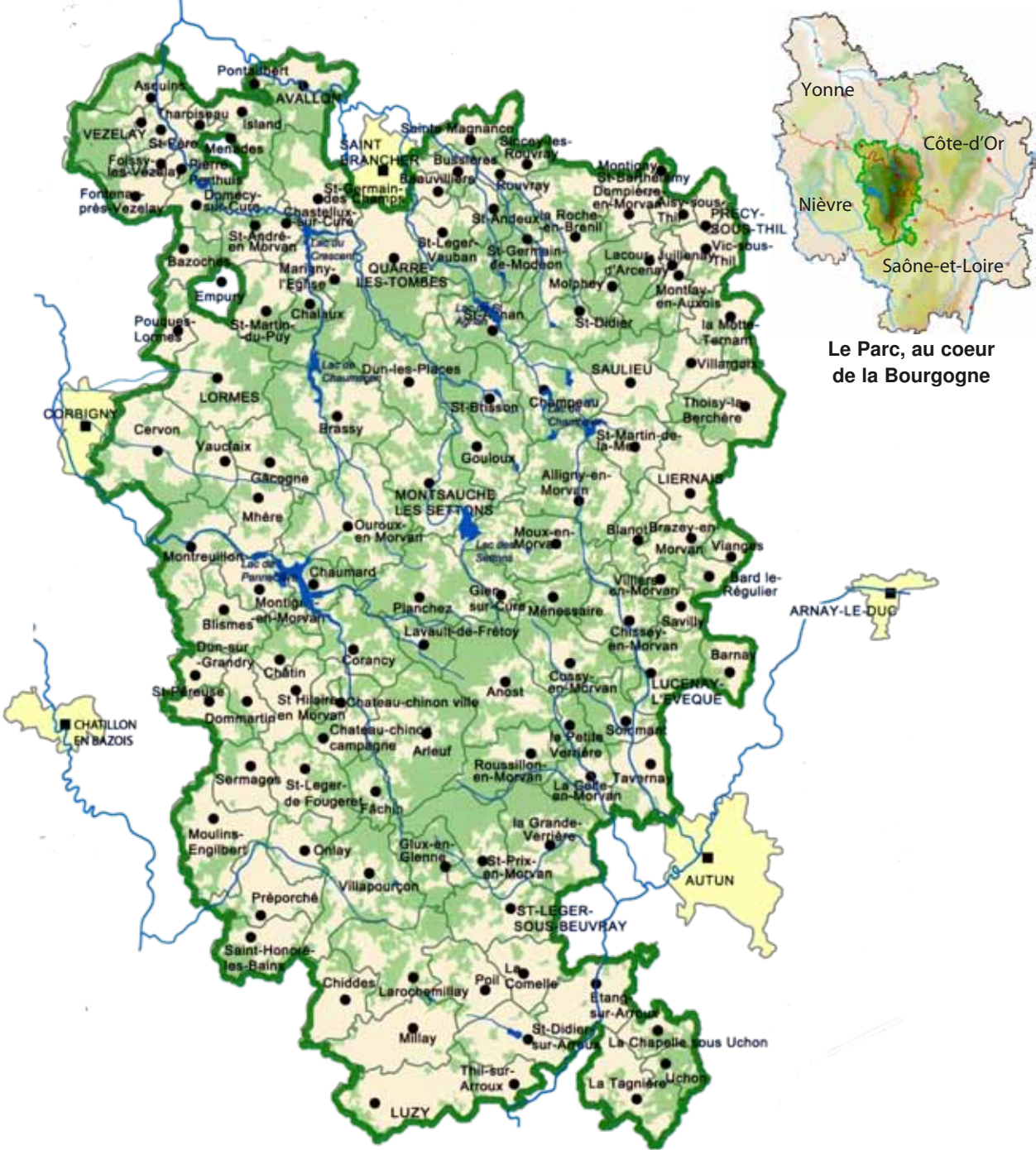
Le Parc, au coeur de la Bourgogne