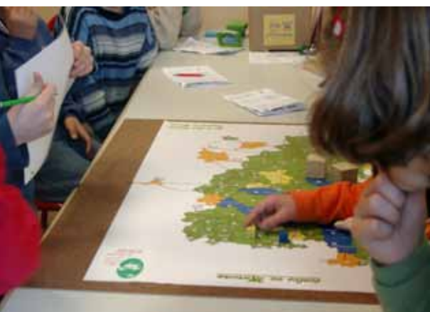
Une activité en salle pédagogique : le Jeu du parc